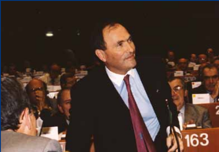
Przecieranie szlaków: Jacques BLANC wybrany na pierwszego wiceprzewodniczącego Komitetu Regionów