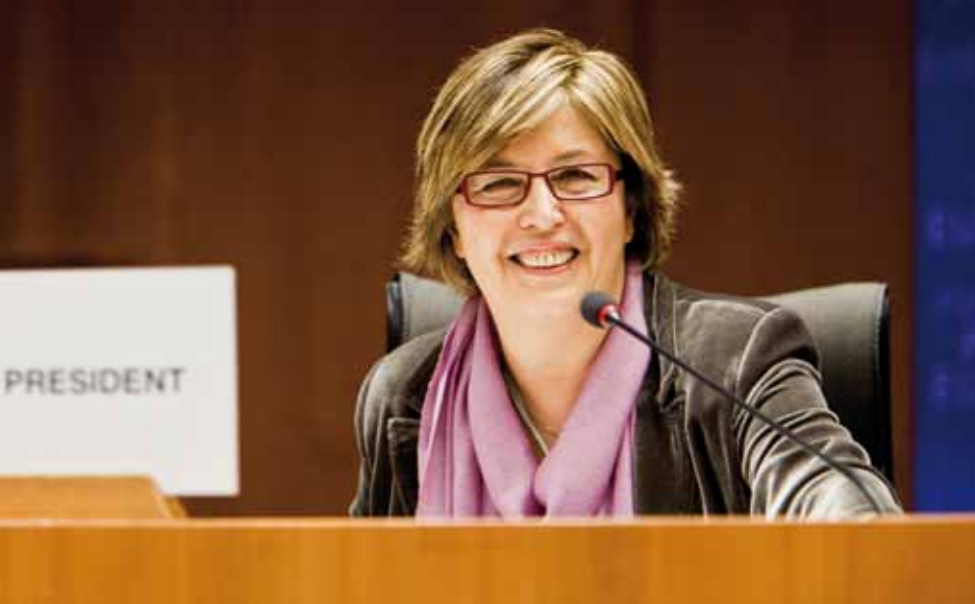
10 lutego 2010 r.: Mercedes BRESSO, radna regionu Piemont, wybrana przewodniczącą Komitetu Regionów.