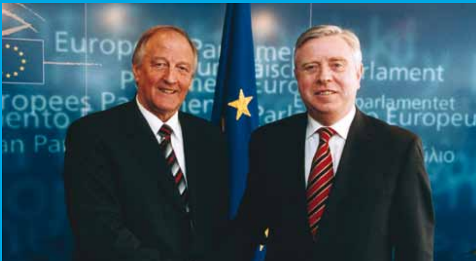
Zacieśnianie związków: były przewodniczący KR-u Peter STRAUB z przewodniczącym Parlamentu Europejskiego Patem COXEM, marzec 2004 r.